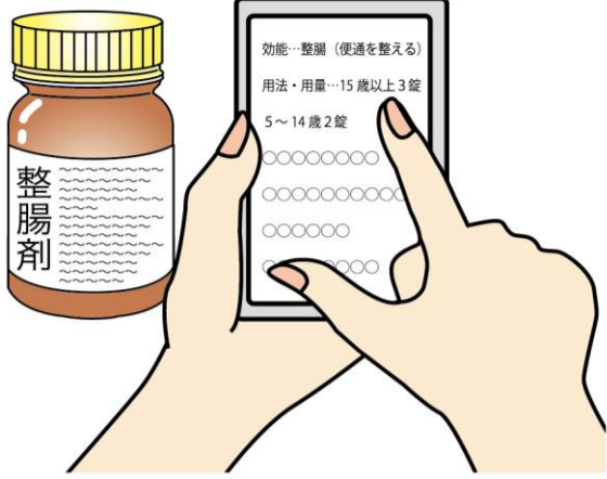
文字が小さい薬の説明書きも写真に撮って拡大すれば見やすい！

カメラ機能で写真を撮り、その写真を拡大することで大きな文字で見ることが出来ます。