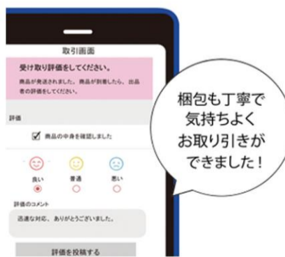
迅速な発送など、印象が良ければ、評価にその旨、お礼と一緒にコメントすると、他の人がその出品者から品物を購入する際の参考になります

●購入したら：「購入しました。どうぞよろしくお願います」などと、取引画面内のメッセージ欄に、ひとこと、メッセージをすることで、顔が見えないやりとりでも、相手に丁寧さと安心感が伝わります。 ●品物が届いたら：中身をチェックし、相手を評価します。中身が問題なければ良い評価をつける場合が多いです。コメント欄にひとこと、お礼を伝えることも、おすすめします。