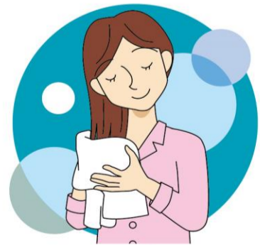
ヘアオイルや洗い流さないトリートメントは入浴後の髪の水分を優しく、しっかりとることで効果に違いが出ます！

ちなみに、トリートメントとコンディショナーの違いってご存じですか？トリートメントは髪に栄養を与え、修復してくれるもの。コンディショナーは、髪の表面を保護してく